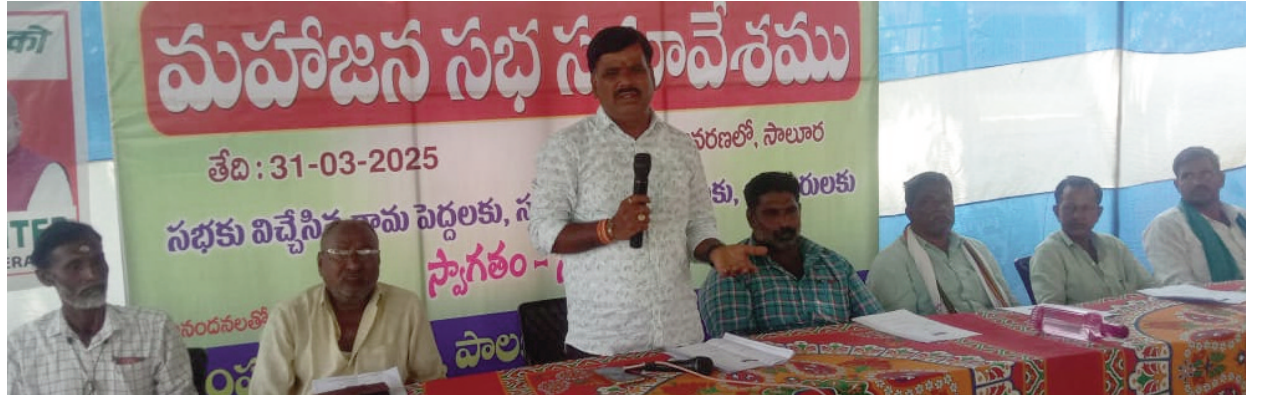
మహాజన సభలో తీర్మాణం చేసిన రైతులు